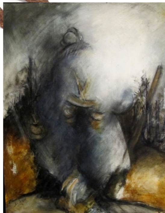
« Soldat de dos » Pigments et tempera sur toile marouflée. 50 x 40 - 2012