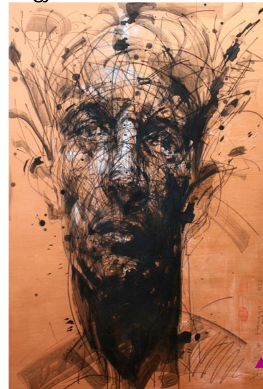
N°160 techniques mixtes sur toile 150x100 cm - 2011

Zhang Hongyu vit et travaille à Paris et à Ulan Hot, Mongolie. Son vocabulaire artistique est donc une symbiose entre les techniques de ses prédécesseurs chinois et l'art occidental, en particulier l'expressionnisme allemand. La calligraphie, l'encre de chine et le fusain dialoguent avec l'acrylique, l'huile, les pastels. Chaque trait possède sa propre existence et symbolise la force. L'ensemble des traits construisent l'espace énergétique. La musique choisie accompagne le tracé du peintre qui le fait courir et danser sur la toile. Traduire le mouvement, le rythme et l'énergie devient son « PAYSAGE HUMAIN ».