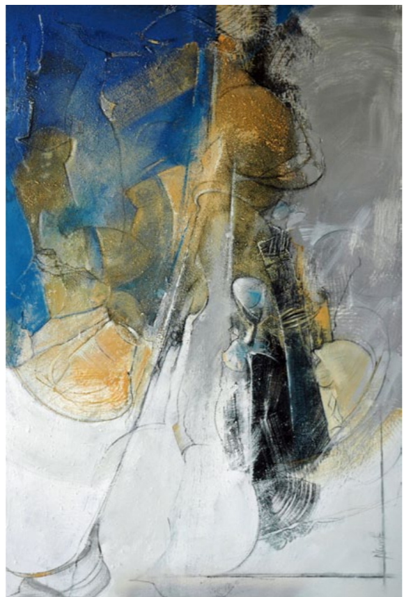
« 1- et tombent et m'émerveillent mes... » huile sur toile 130 X 195

** DES 19H, LES BAS D'BIQUETTES REVISITERONT EN CHANSONS LES GENERIQUES DES DESSINS ANIMES DES 90', PUIS BAPTISTE BOULAT ET AMIS NOUS ENCHANTERONT AU SON DE LEURS GUITARES