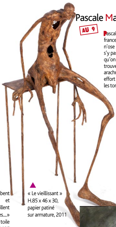
« Le vieillissant » H.85 x 46 x 30, papier patiné sur armature, 2011