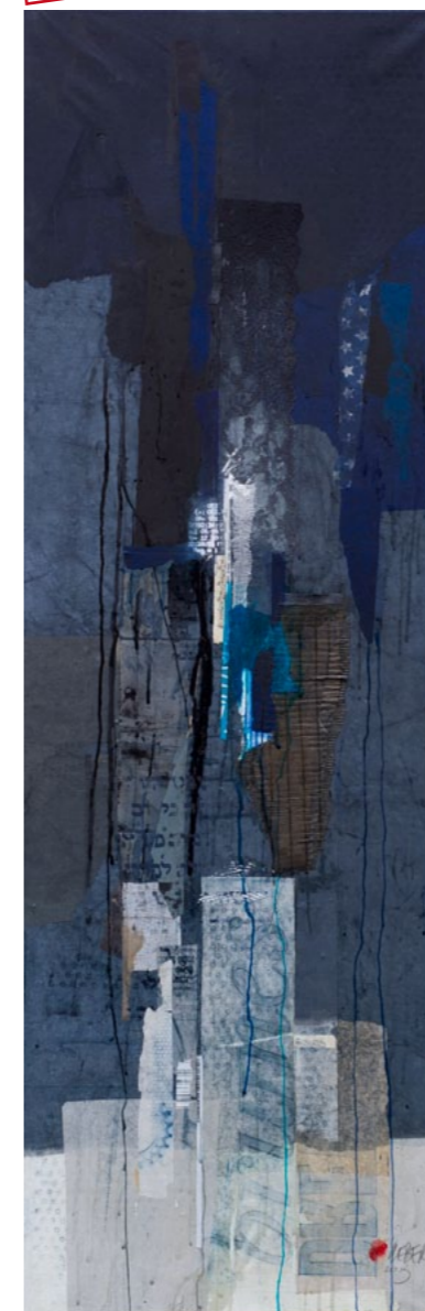
Totem #8 collage et techniques mixtes sur toile 50 x 150cm - 2013

Claude Lieber Atelier : 5 rue Robert Fleury 75015 Paris 06 07 34 58 71 clieber@wanadoo.fr claudelieber-galerie.com