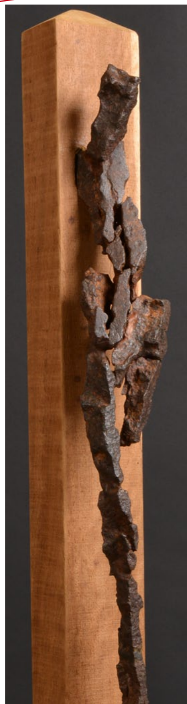
« Pour l'exemple II » Eclats d'obus, bois H : 176 - 2012