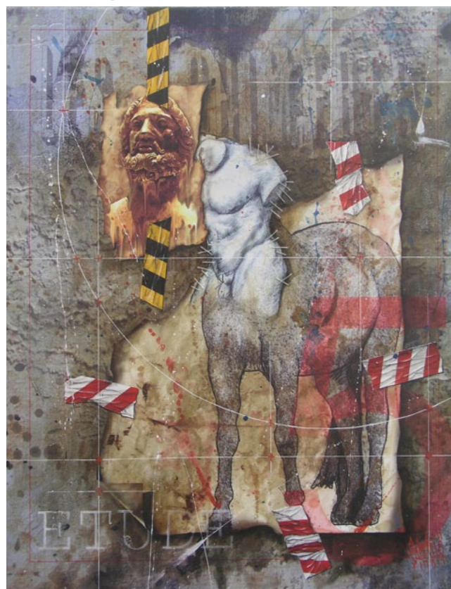
Les Chimères, étude 5 « Le Centaure » huile et impression numérique sur toile - 62 x 78 cm - 2010

« J'aime dire que je fais une peinture d'évocation; je mets en scène des images chargées de sens nées d'une subjectivité toute personnelle... Ces compositions puisent à une source constante : la mémoire; mémoire individuelle, historique, collective... A partir de ces fragments de mémoire la porte s'ouvre au vagabondage de l'esprit. Fantômes d'histoire, réminiscences intimes, rêves, fantasmes... autant d'invitations au voyage, aux jeux de l'imagination... Jeux jubilatoires qui impliquent, il est vrai, de donner au regard le temps d'une errance attentive... »