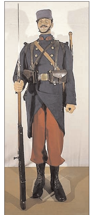
Fantassin du 27 e régiment d'infanterie. Tenue de campagne Vue de face. Inv. Ga 451 06-518115