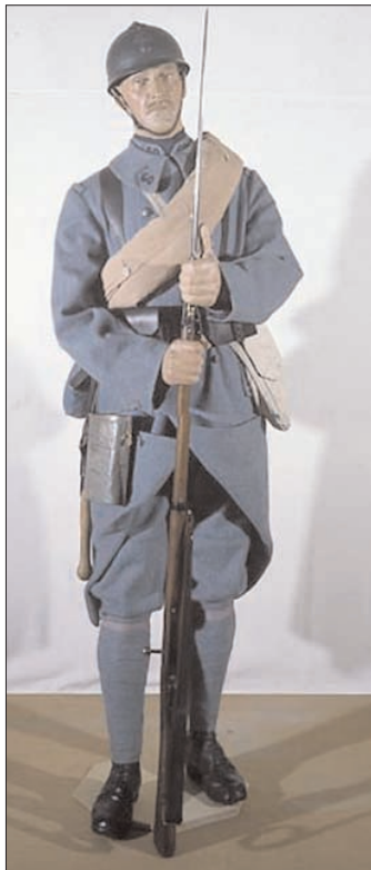
Fantassin du 60 e régiment d'infanterie. Uniforme dit du "poilu". Inv. Ga 452

Toutes les troupes métropolitaines et coloniales perçoivent cette tenue sauf les troupes de l'armée d'Afrique qui reçoivent des tenues de couleur kaki tirant sur le jaune moutarde. Pour protéger la tête des soldats, l'État-major fait distribuer 700 000 cervelières entre février 1915 et fin 1915. Ces calottes métalliques, à placer sous le képi, constituent une protection aussi peu pratique qu'inopérante et finissent souvent en ustensiles de cantine. Le casque Adrian, métallique, commence à doter les unités à partir de septembre 1915 ; il est, dans