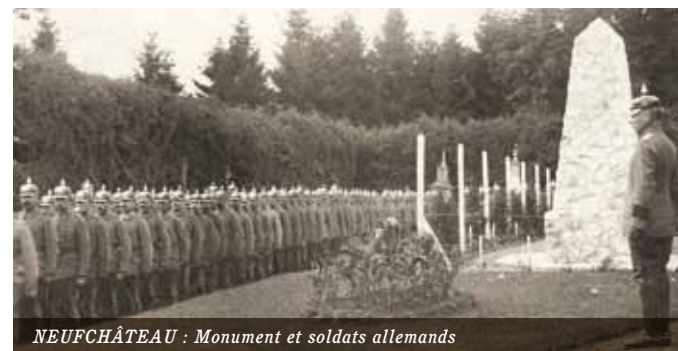
NEUFCHÂTEAU : Monument et soldats allemands