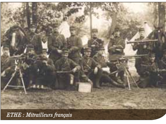
ETHE : Mitrailleurs français

H.-C. : Hors combat se dit d'un soldat dont l'état ne permet pas de poursuivre la lutte : tué, blessé ou prisonnier.