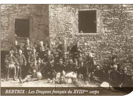
BERTRIX : Les Dragons français du XVIII ème corps