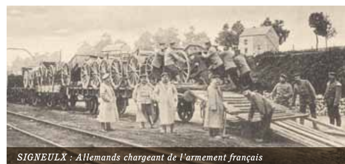
SIGNEULX : Allemands chargeant de l'armement français

Dès septembre, les Allemands occupent notre territoire. Ils sont en route vers Paris. Sur la Marne, la contre-offensive française oblige les Allemands à reculer. Elle sauve la capitale. Le front se fige alors sur une ligne d'environ 800 km (Nieuport-Mulhouse). Les armées s'enterrent mais la Belgique et tout le Nord-Est de la France sont occupés.