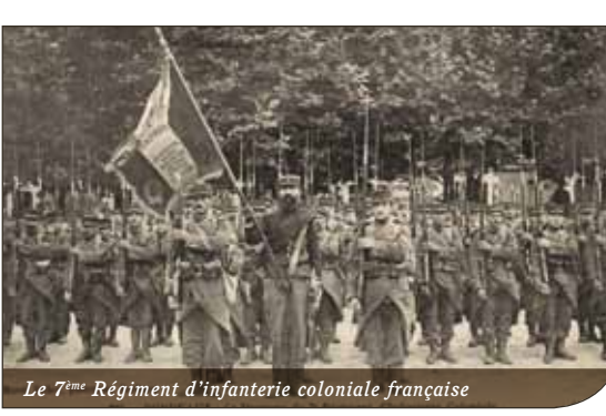
Le 7 ème Régiment d'infanterie coloniale française