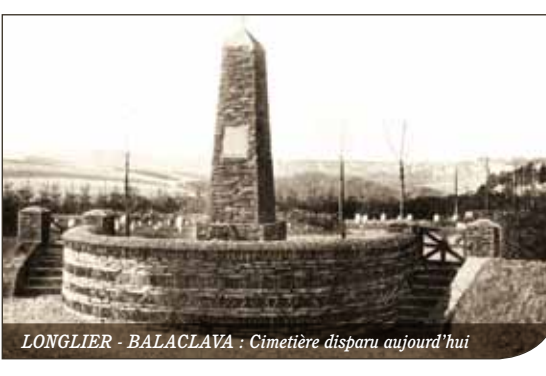
LONGLIER - BALACLAVA : Cimetière disparu aujourd'hui