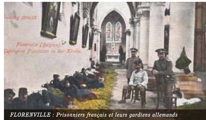
FLORENVILLE : Prisonniers français et leurs gardiens allemands

Ces batailles se soldent presque toutes par l'échec de l'armée française, suivi de sa retraite jusqu'à la Meuse. Le nord de la France et la Belgique sont envahis et occupés. En une seule journée, le 22 août, 16 940 Français et 9 335 Allemands sont morts au combat sur le front central. En septembre débute la bataille de la Marne qui amène une victoire à la France, stoppant ainsi l'aile droite allemande.