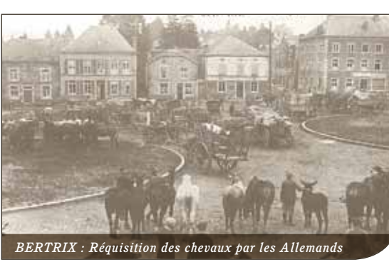
BERTRIX : Réquisition des chevaux par les Allemands