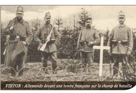
VIRTON : Allemands devant une tombe française sur le champ de bataille